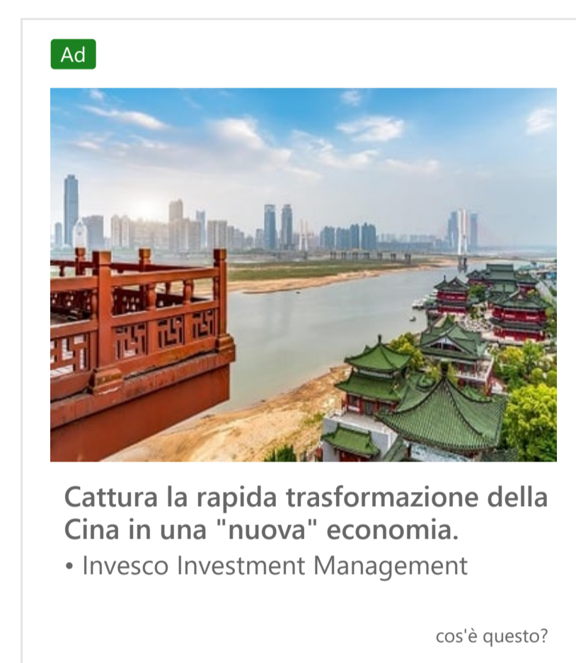
Cattura la rapida trasformazione della Cina in una "nuova" economia. Invesco Investment Management

"Stiamo lavorando a una graduale e cauta uscita dalle misure di sostegno e flessibilità garantite alle banche e il livello dei buffer patrimoniali verrà definito nelle lettere Srep che rifletteranno anche i risultati degli stress test che verranno resi noti a fine mese", ha infatti spiegato Enria. "Quest'anno facciamo girare uno scenario avverso molto pesante e sfidante per le banche, che sono preoccupate per possibili assorbimenti patrimoniali elevati ma la metodologia messa a punto offre risultati ragionevoli".