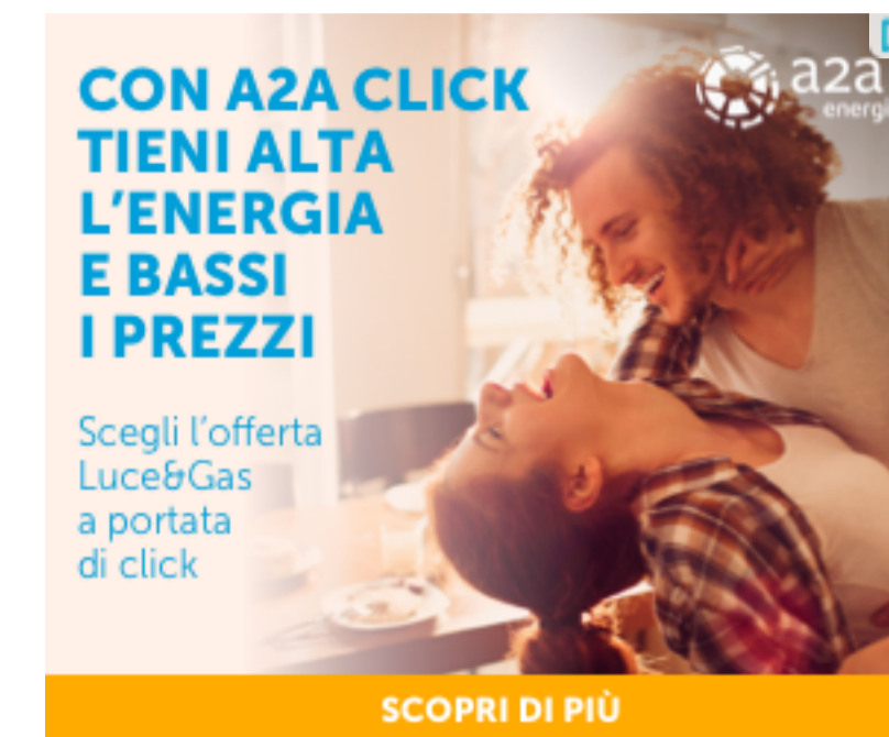
SCOPRI DI PIÙ